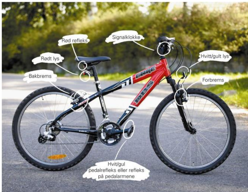
Utstyr som er påbudt ved sykling på offentlig vei.